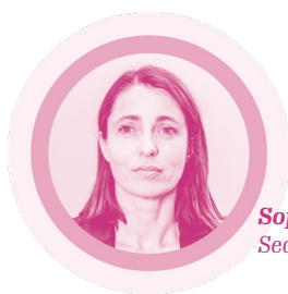
Sophie Binet, Secrétaire générale de la CGT