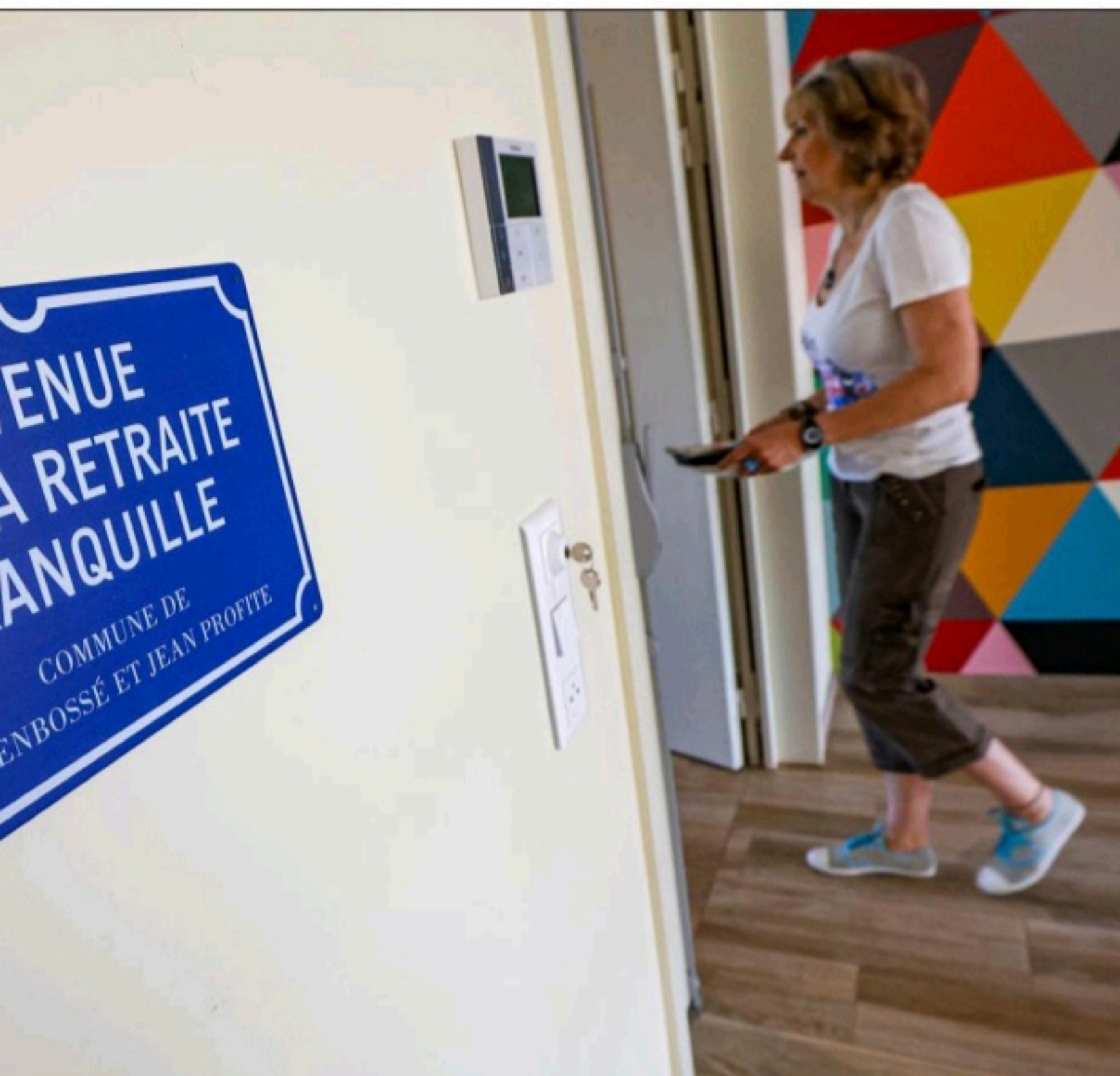
Avec cette réforme des retraites, certains dénoncent « une injustice ».